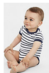
SOL'S MILES BABY 01401