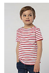
SOL'S MILES KIDS 01400